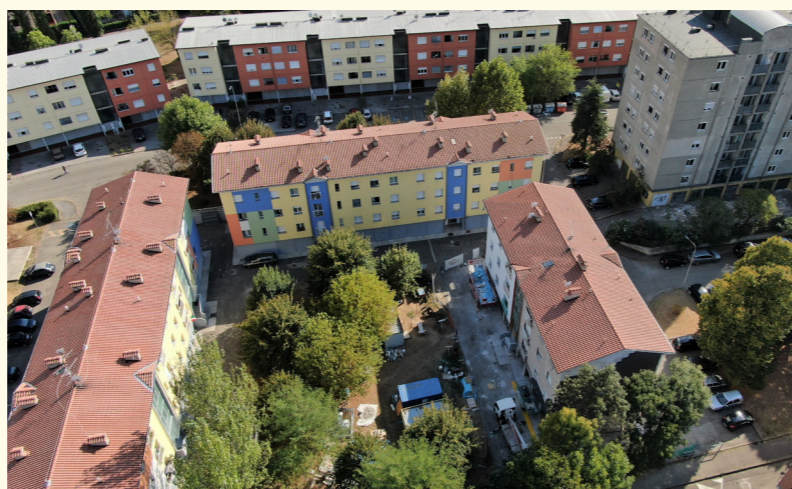
Sassuolo comparto Unicapi