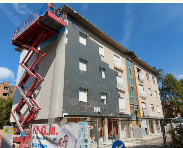
Sassuolo Via Respighi 40